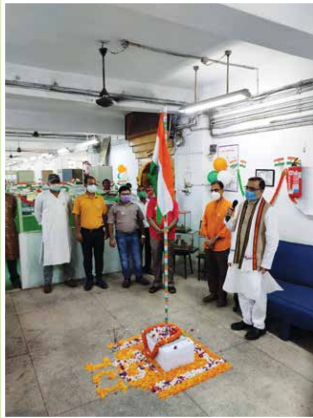
Independence Day being celebrated at the Head Office of the Corporation