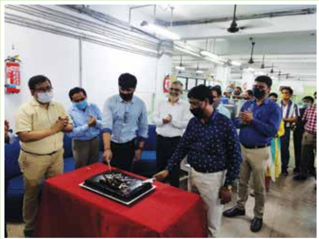
Celebration of Commemoration of 50 Years of JCI at Head Office