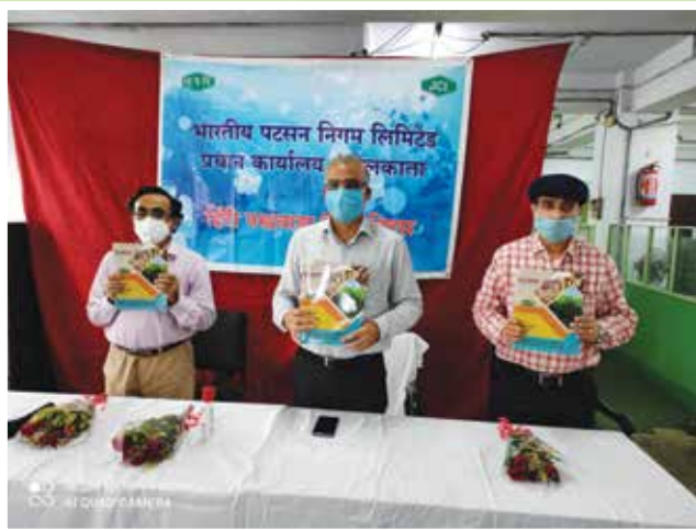
Release of "Patsan Jyoti" the inhouse Hindi Magazine of JCI, during Hindi Pakhwada